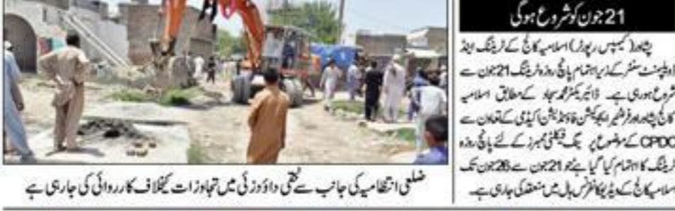
شہر کے مختلف حصوں میں تعمیراتی کاموں کی رفتار تیز ہو رہی ہے

480 سوشل سروس پروگراموں کا آغاز۔ سوشل سروس پروگراموں کا آغاز کیا گیا۔ انہوں نے کہا کہ سوشل سروس پروگراموں کا آغاز کیا گیا۔ انہوں نے کہا کہ سوشل سروس پروگراموں کا آغاز کیا گیا۔ انہوں نے کہا کہ سوشل سروس پروگراموں کا آغاز کیا گیا۔