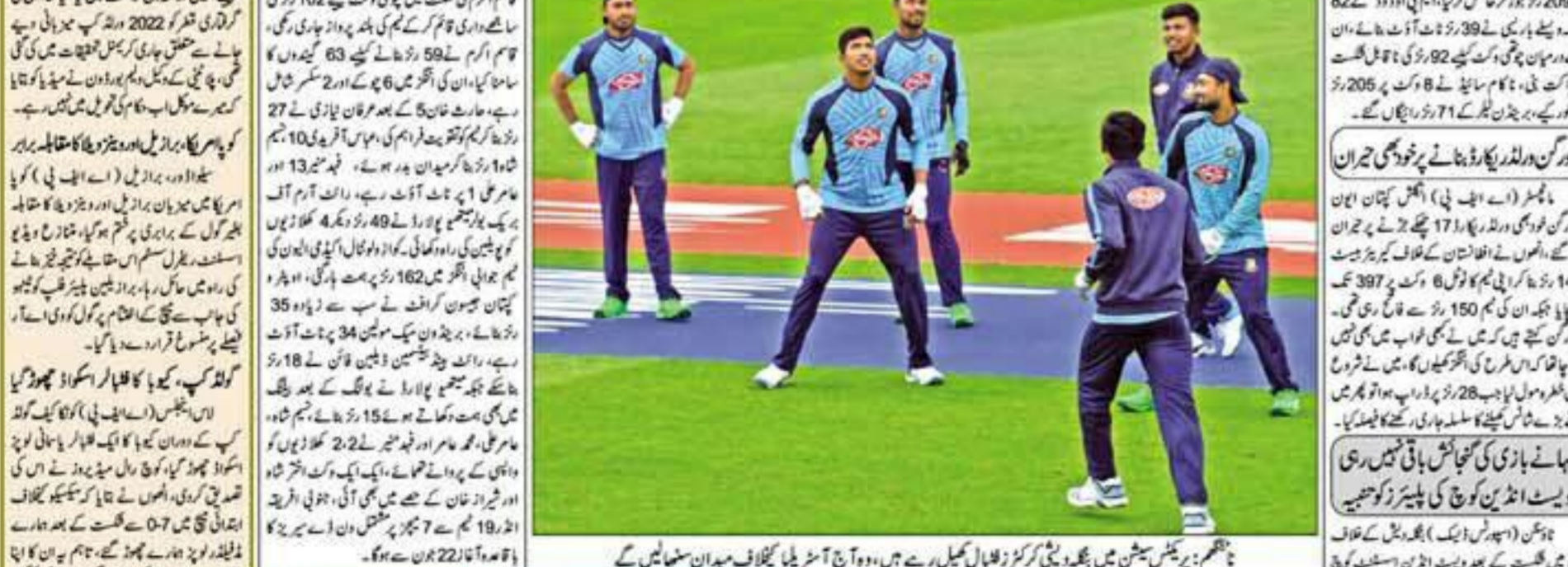
پانچم پر پیکش میں بھارتی کرکٹرز گلوبل ٹیکل رہے ہیں۔ وہ آج آسٹریلیا کے خلاف میڈیا سٹیشن میں

دورہ جنوبی افریقہ، حیدر علی حریف یولرز پر لوٹ پڑے دورہ جنوبی افریقہ، حیدر علی حریف یولرز پر لوٹ پڑے۔ حیدر علی حریف یولرز پر لوٹ پڑے۔