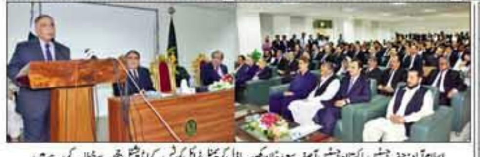
اسلام آباد: چیف جسٹس پاکستان جسٹس آصف سعید کٹکھن نے ایف بی سی کے ایڈیٹر جیو سے خطاب کر رہے ہیں

پاکستان کے 11 شہروں سے ایک وقت شائع ہونے والا واحد اخبار 17 ص 258 | 16 شمار | 16440 | 20 جون 2019ء | صفحات 12 قیمت 20 روپے