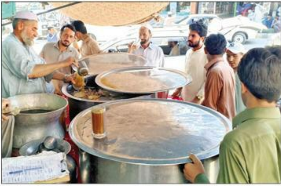
لوڈیز، گرمی کی شدت سے بچنے کیلئے شہر کے محلات سے لطف اندوز ہو رہے ہیں