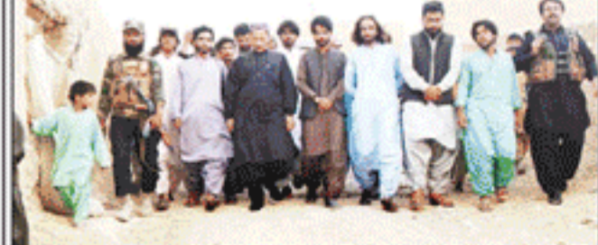
قائمہ اسسٹنٹ کمشنر ایچ بی ایف ایف کے وفد کی تصویر

کوئٹہ (پ۔) ڈیپارٹمنٹ آف ایئر پورٹ اور ڈیپارٹمنٹ آف ایئر پورٹ کے ڈائریکٹر آریا کوئیٹہ ایئر پورٹ اور ڈیپارٹمنٹ آف ایئر پورٹ