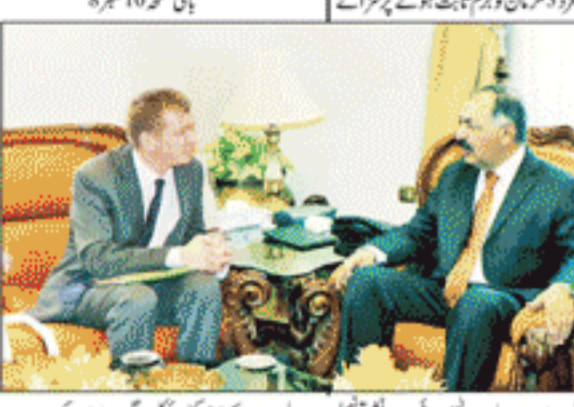
کوئٹہ: گورنر بلوچستان اور ایڈیشنل چیف سیکرٹری ہونٹن راج پٹیل نے ایک میٹنگ میں بات چیت کی۔

امریکی فوجیوں نے طالبان کے ساتھ بات چیت کے دوران امریکہ اور طالبان کے مابین ہونے والے دہائیوں کے آئندہ 2019 میں بات چیت کا مورخہ افغانستان سے فوجی ناکرہ کیلئے امریکی فوج کا نخلہ اور طالبان کی جانب سے اس بات کی تصدیق دہانی رہے گی افغانستان کی سرزمین سے کوئی مسکری حملہ نہیں کیا جائے گا