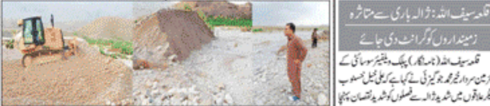
قلعہ سیف اللہ عمارتوں اور عیناتی تعمیر کی تصویر

حسب زینبنداروں کو برابری کی بنیاد پر پانی فراہم کیا جائے