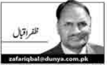
زفر اقبال zafariqbal@dunya.com.pk