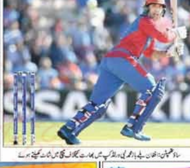
سڈھوٹن: انڈیا نے بھارتی ورلڈ کپ میں بھارت کے خلاف ٹیسٹ میچ میں شکست کھینچ لی ہے

حکومت کی حکم عدولی کرنے پر ڈرمیاہوے کرکٹ بورڈ معطل کرکٹ بورڈ نے روکنے کے باوجود ایشیا کی ٹیسٹ کرکٹ کی