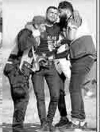
غزہ قسطنطنیہ میں اسرائیلی فوج کی فینک کے بعد مظاہرین نے شریک ایک ٹو جہان ڈی ہو کر گرا رہا ہے۔ اور سے گواہی دہا کرن میں لہا کیلئے لہا جاتے ہوئے