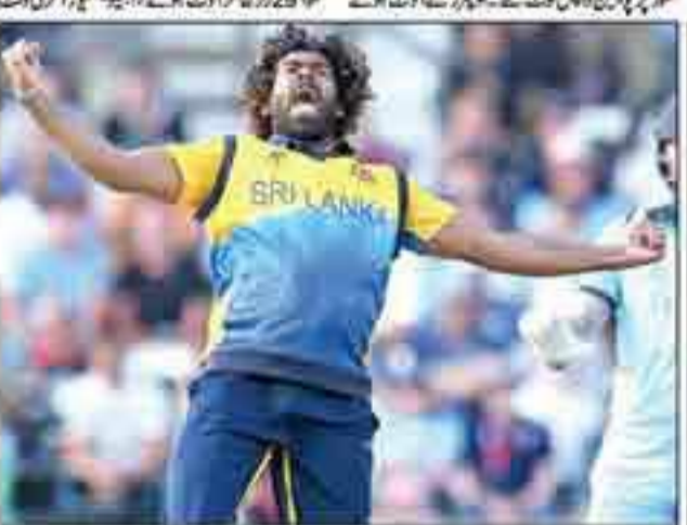
انگلینڈ کی واپس لوٹنے والی ٹیم کے کپتان، بین سٹوکس کے 82 رنز ناٹ آؤٹ، جو روٹ کے 57 رنز بھی فیورٹ ٹیم کو 20 رنز کی شکست سے بچانے کے لیے لڑا۔

پاکستان کی کرکٹ تاریخ میں ایک ایسا دن تھا جس کا ذکر کرنا ہر کرکٹر کے لیے ایک خاص لمحہ ہے۔ لارڈز کرکٹ گراؤنڈ میں پاکستان کی ٹیم نے انگلینڈ کی ٹیم کو 20 رنز سے شکست دے کر اپنی تاریخ میں ایک تاریخی فتح منائی۔