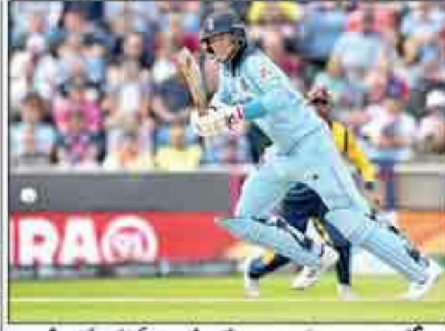
لیڈنگ اسٹریک میں سری لنکا کے میچ ایونٹ میں پہلی کامیابی، ٹاس جیت کر 9 وکٹوں پر 232 رنز بنائے، انجیلو متھیوز کے ناقابل شکست 85، ہیٹھی ملنگ 4 وکٹیں لے کر مریدان بنے

انگلینڈ کی پوری ٹیم 47 اوورز میں 212 رنز بنا کر ڈھیر، بین سٹوکس کے 82 رنز ناٹ آؤٹ، جو روٹ کے 57 رنز بھی فیورٹ ٹیم کو 20 رنز کی شکست سے بچانے کے لیے لڑا۔