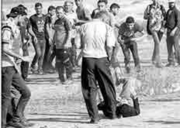
غزہ قسطنطنیہ میں اسرائیلی فوج کی فینک کے بعد مظاہرین نے شریک ایک ٹو جہان ڈی ہو کر گرا رہا ہے۔ اور سے گواہی دہا کرن میں لہا کیلئے لہا جاتے ہوئے