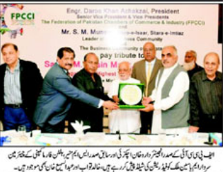
ایف پی سی کے صدر ایف ایف ایف کے ساتھ دیگر افسران کی تصویر

روان مالی سال: بجٹ خسار 1922 ارب روپے تک پہنچ گیا بجٹ خسار میں اضافہ ہونے کی وجہ سے حکومت کو روپے کی کمی کا سامنا کرنا پڑا ہے۔ بجٹ خسار 1922 ارب روپے تک پہنچ گیا ہے۔