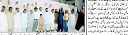
سیکس کراچی کی راجھا راجھا کے صدر نے پتھر پھینکا اور ہیرس کلب کے سربراہ کو ہیرس کلب سے نکال دیا۔

لیڈر شریقی کی ہتھیاری کیلئے برہمن گن کے اقدامات بروئے کار لائیں۔ برہمن گن کے اقدامات میں ہزاروں لوگوں نے شرکت کی۔