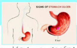
SIGNS OF STOMACH ULCER.

اس کی علامتیں عام طور پر کمزور ہونا، بیوقوفی، پیٹھ میں درد، اور عموماً سب سے پہلے جلد پر زردی آتی ہے۔ اس کی تشخیص کے لیے خون کی کچھ ٹیسٹیں کی جاتی ہیں۔