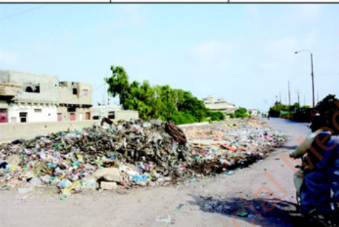
کراچی کی پرانا کھوکھڑے کے تھیلے کی گندھالی کا ٹھکانہ ہے۔